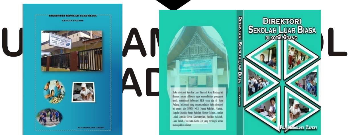
Cover sebelum direvisi

Desain cover dibuat menggunakan Microsoft Word . Pada bagian sampul atau cover, pembimbing berpendapat bahwa sampul tersebut perlu direvisi dan ditambah gambarnya. Penulis membuat bagian cover dengan gambar sekolah yang tidak terlalu jelas dengan gambar yang sedikit. Setelah melakukan perbaikan atas saran yang diberikan, pembimbing menyatakan bahwa cover produk Sekolah Luar Biasa di Kota Padang ini sudah efektif dan efisien pada tanggal 3 maret 2018. Komponen-komponen yang terdapat di dalam rangkain Sekolah Luar Biasa di Kota Padang ini sudah lengkap. Adapun rangkain pertama sampul dan hasil yang sudah direvisi.