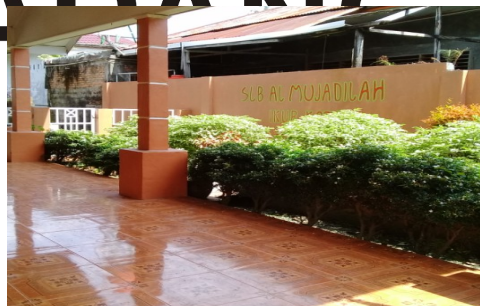
SLB AL MUJADILLAH PADANG