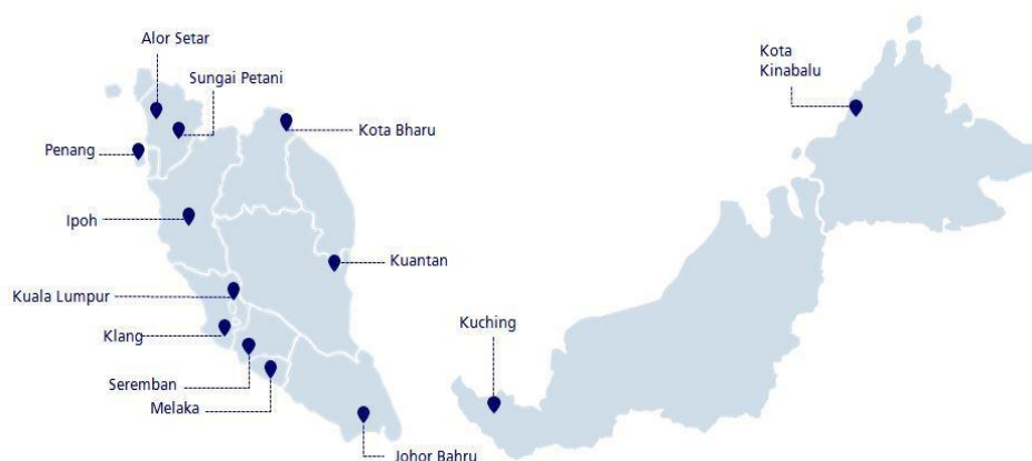
Gambar 1. Jaringan Kantor Cabang

Zurich Takaful Malaysia Berhad memiliki 13 jaringan kantor cabang nasional yang luas untuk melayani kebutuhan takaful masyarakat. 1