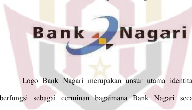
Gambar 3.1 Logo Bank Nagari

Logo Bank Nagari merupakan unsur utama identitas visual yang berfungsi sebagai cerminan bagaimana Bank Nagari secara sadar dan terencana, mengemukakan dirinya baik secara sadar dan terencana, menegemukakan dirinya baik secara verbal maupun visual. Identitas visual merupakan gabungan dari logogram, logotype, dan warna standar logo yang bekerja sama membentuk sistem visual secara unik dan kohesif.