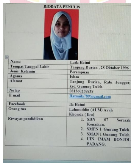
Gambar 6. Biodata Penulis.