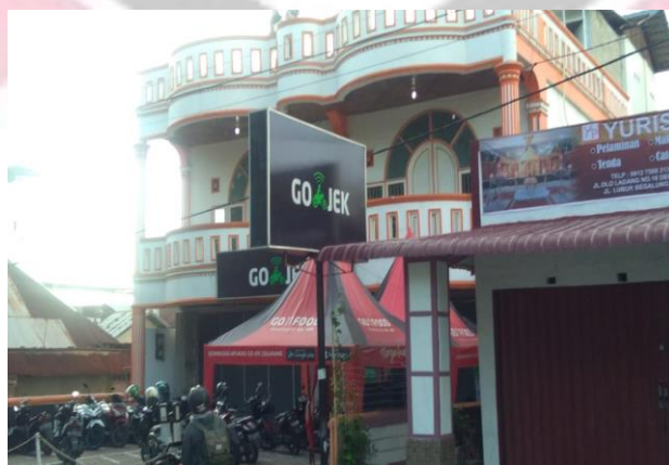
Gambar : Plang kantor Go-Jek kota Padang