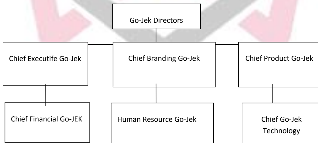
Bagan 1. Struktur Organisasi PT Go-Jek Indonesia