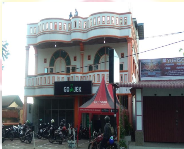
Gambar : Kantor Go-Jek kota Padang

transaksi yang fungsinya untuk mempermudah konsumen dalam bidang transportasi dan transaksi secara online. Data terakhir jumlah driver Go-Jek sebanyak 5000 driver yang sudah diregistrasi beroperasi pada tahun 2018 (Robi, Wawancara, 2018). Pada awalnya kantor Go-Jek cabang kota Padang beralamat di Jalan Imam Bonjol No.21 A, Belakang Pondok, Padang Selatan. Sekarang pindah di Jalan Olo Landang No.18, Purus, Padang Barat, Kota Padang, Go-Jek di kota Padang mulai beroperasi sejak bulan Maret 2017. Saat ini keberadaan Go-Jek sangat diminati untuk transportasi dalam kota karena akses untuk mendapatkan layanannya sangatlah gampang. Kita cukup memiliki aplikasi Go-Jek di handphone android kita (Deni 2019, 73)