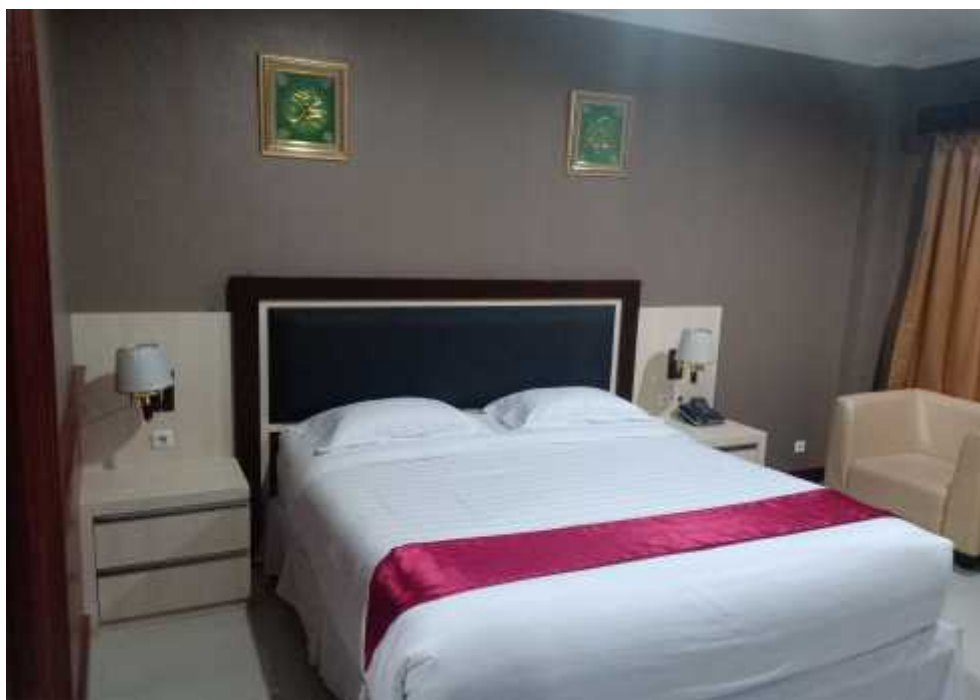
Gambar 15 Petunjuk arah kiblat