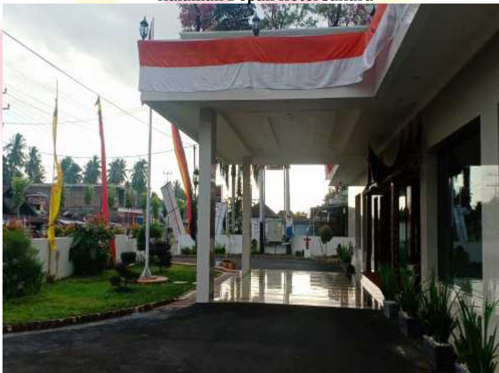
Gambar 2 Halaman Depan Hotel Sakura

Hotel Sakura Syariah merupakan hotel yang mengutamakan konsep syariah baik dari segi pengelolaan, pelayanan maupun fasilitas yang disediakan dan juga mengutamakan gaya berpakaianya maupun sopan santunya dalam melayani tamu. Hotel berbintang 3 ini mempunyai 5 Lantai dengan 70 kamar dan berbagai fasilitas yang ada seperti fasilitas umum terbagi dua, yang pertama Fasilitas Ibadah seperti Musholla, Al-Qur'an, Mukenah, sejadah, arah kiblat, yang kedua fasilitas tata ruang seperti Laundry, free Wi-Fi, Swimming Pool, Karaoke Room , dapur, lobby , ruang karyawan, toilet umum, Air Conditioner, Shower/Bathub, Hot & Cold Water, TV 32 & 43, Breakfast Buffe, Car Rent, Meeting Room dan lain sebagainya (Sari General Manager, 2019).