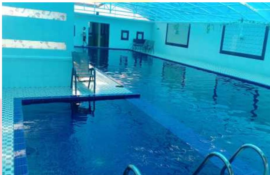
Gambar 10 Kolam Renang

memberikan kepuasan kepada tamu yang datang, baik dalam urusan bisnis maupun dengan tujuan untuk menginap. Selain itu, bidang ini dilengkapi dengan fasilitas penunjang untuk memenuhi kebutuhan tamu seperti adanya ruang Karaoke, Kolam renang, dan lain sebagainya.