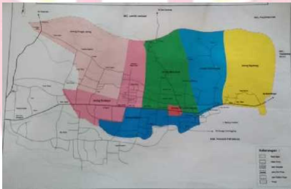
Gambar 8 Peta

Hotel Sakura Syariah berlokasi di jalan Diponegoro No.241, kecamatan Lubuk Basung, Kabupaten Agam. Kabupaten Agam berjarak 116,3 km dari kota Padang atau dapat ditempuh dengan waktu 3 jam melalui jalan By Pass, sedangkan dari kota Bukittinggi memiliki jarak 84,1 km atau waktu tempuh kurang lebih dua jam. Jarak tempuh ke puncak lawang diperlukan waktu kurang lebih satu jam untuk menuju lokasi ini melalui jalan Maninjau-Lubuk Basung dengan jarak 37,7 km, 45 menit dari danau Maninjau, 20 menit dari pusat pasar dan 35 menit dari pantai Tiku. Oleh karena itu Hotel Sakura Syariah dapat dikatakan berada di tempat yang strategis dan dipinggir jalan untuk pengunjung yang ingin menginap ataupun mengadakan sebuah pertemuan.