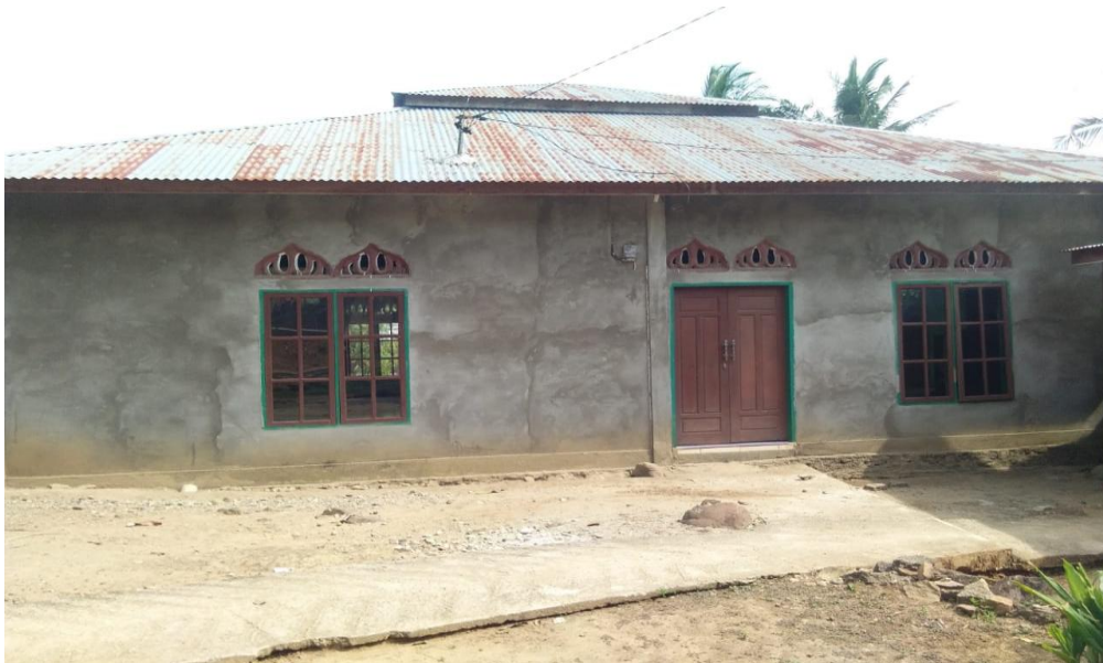
Gambar 3.5 Masjid al-Munawarah Siayung