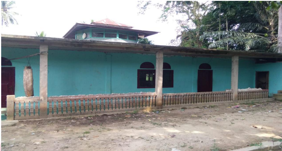
Gambar 3.3 Masjid Nurul Islam Marapan