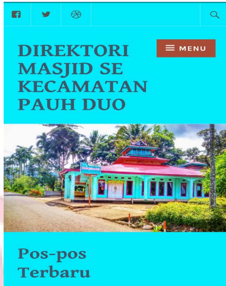
Gambar 3. 2. Rancangan awal beranda direktori yang telah di validasi

Berikut merupakan perbaikan setelah kunsultasi dengan validator ahli.