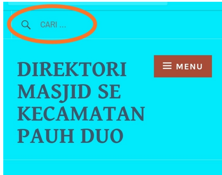
Gambar 3. 7. Cara pencarian informasi dengan fitur searching (pencarian)

Menggunakan fitur searching di kolom pencarian membuat pengguna lebih mudah menemukan informasi masjid yang ingin dicari, karena hanya dengan mengetikkan nama masjid atau nagari di kolom pencarian, maka secara otomatis informasi tentang sebuah masjid yang dicari tersebut akan langsung muncul dan pengguna bisa langsung menemukan informasi yang diinginkan itu.