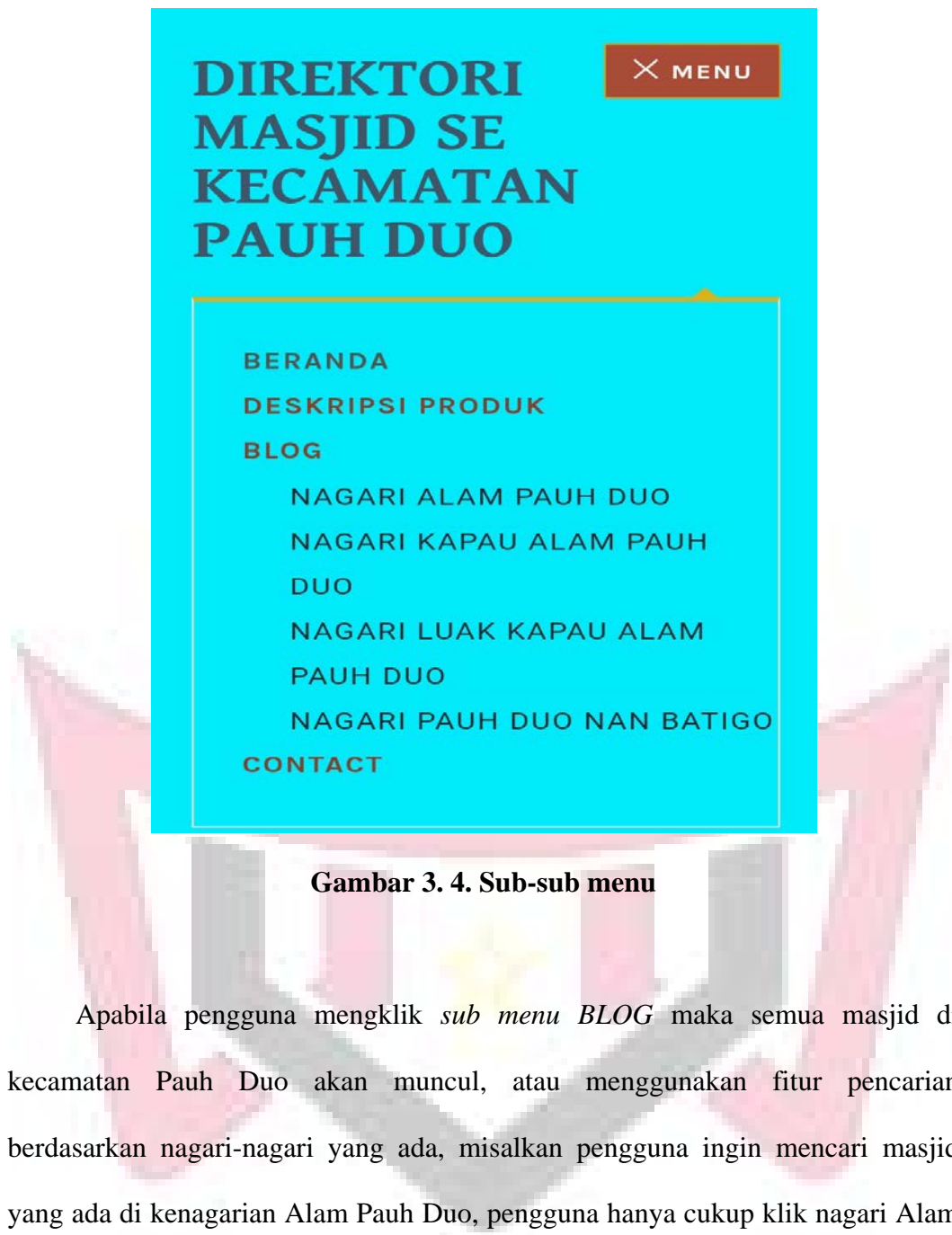
Gambar 3. 4. Sub-sub menu

Apabila pengguna mengklik sub menu BLOG maka semua masjid di kecamatan Pauh Duo akan muncul, atau menggunakan fitur pencarian berdasarkan nagari-nagari yang ada, misalkan pengguna ingin mencari masjid yang ada di kenagarian Alam Pauh Duo, pengguna hanya cukup klik nagari Alam Pauh Duo, maka semua masjid yang ada di kenagarian tersebut akan muncul dan tinggal pilih masjid yang ingin dicari informasinya.