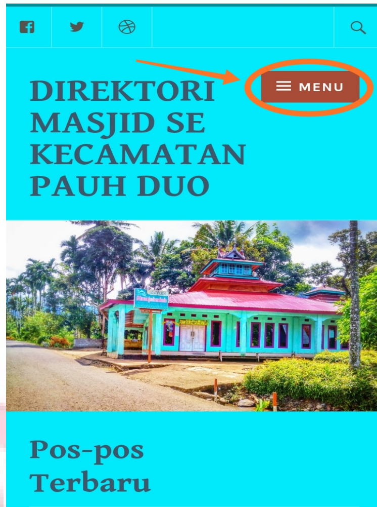
Gambar 3. 3. Tombol menu

Apabila tombol menu di klik maka sub-sub menu akan muncul dan pengguna bisa mencari informasi masjid berdasarkan nagari yang ada di kecamatan Pauh Duo.