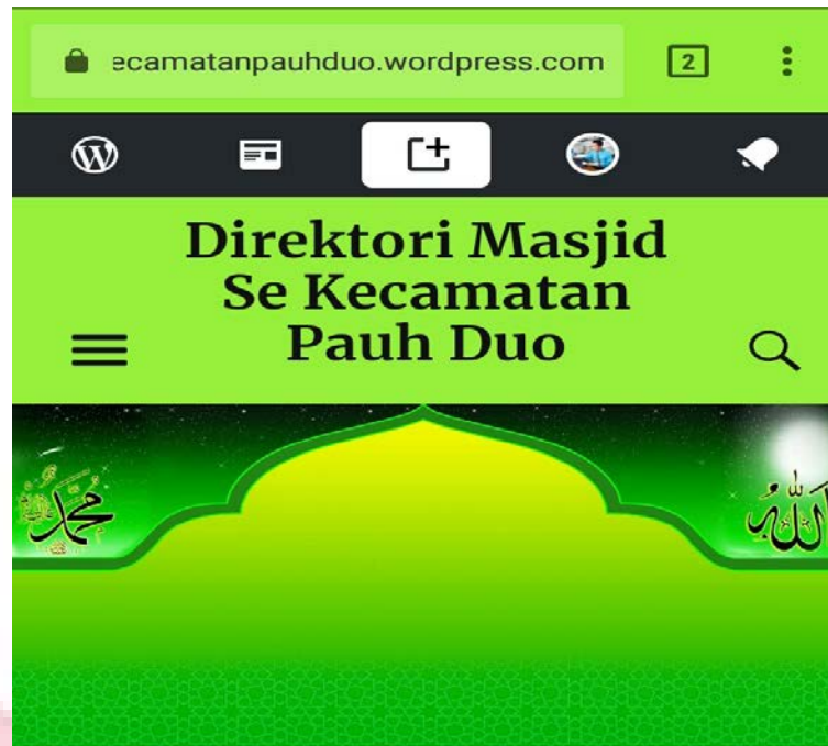
Gambar 3. 1. Rancangan awal beranda direktori

Setelah pembuatan rancangan awal beranda direktori , kemudian dilakukan validasi oleh validator ahli, sebelum divalidasi beliau menyarankan agar tema dan warna background hendaknya diganti dengan yang lebih sederhana tapi menarik untuk dilihat pengguna.