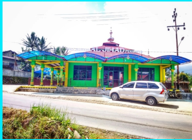
Gambar 3. 5. Contoh masjid di kanagarian Alam Pauh Duo

Ketika semua masjid yang ada di kenagarian Alam Pauh Duo muncul salah satunya seperti gambar di atas, pengguna bisa mengklik nama masjid atau gambar masjid untuk menampilkan keseluruhan informasi seputar masjid yang dicari.